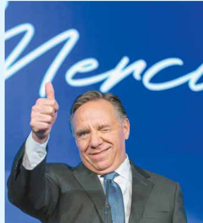
François Legault photographié le soir de la victoire de la CAQ aux élections générales