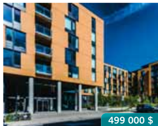
La Petite Patrie | 5661 De Chateaubriand, app. 601