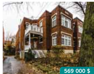
CDN | 5633 Plantagenet