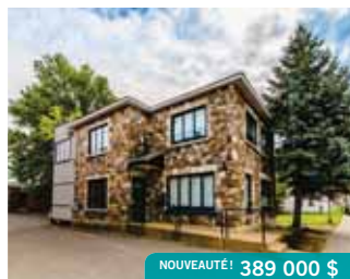
Chomedey | 3940 St-Martin O.