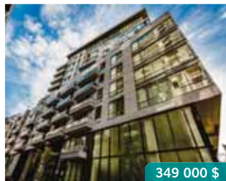
Vieux-Montréal | 370 St-André, app. 603