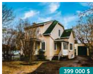
Chomedey | 3846-3848 Souvenir