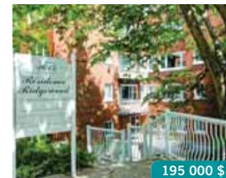
CDN | 3615 Ridgewood, app. 401