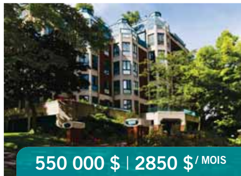
Outremont | 1001 Mont-Royal, app. 405