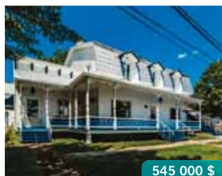
St-Sulpice | 731-731A Bord-de-l'Eau