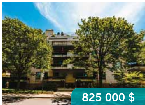
Outremont | 90 Willowdale, app. 303