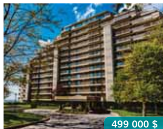
Outremont adj. | 6301 Northcrest, app. 14N