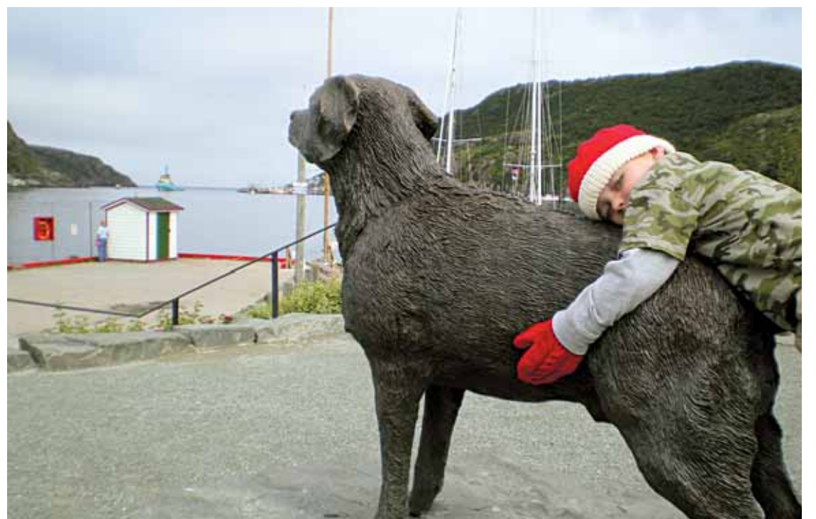
JACINTHE TREMBLAY LE DEVOIR

Il y a une semaine, jour pour jour, les Terre-Neuviens ne s'inquiétaient pas des guerres entre Saint John's et Ottawa, pas plus que de la capacité des Chinois à arrêter la pluie pour l'ouverture des Jeux. Leur préoccupation était tout autre. «Faut-il maintenir la tenue de la Royal St. John's Regatta, et le congé férié qui l'accompagne le premier mercredi d'août ou, en cas de mauvaise météo extrême, le prochain jour de beau temps?», débattaient-ils en grand nombre sur le site Internet du quotidien The Telegram . «Il faut cesser la stupide et archaïque tradition qui prévoit l'arrêt de toute activité économique en plein milieu de la semaine», pouvait-on y lire. «Il faut la préserver parce