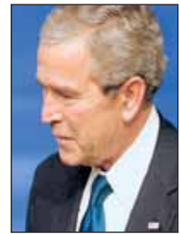
George W. Bush

«En votant le plus vite possible un plan de croissance efficace, nous pouvons donner un coup de pouce pour maintenir la santé de l'économie», a dit le président Bush en concédant que certains secteurs traversent des «ajustements» et génèrent des «préoccupations réelles», notamment l'immobilier. Cette aide, a-t-il souhaité, «empêchera» les difficultés de ces secteurs de contaminer le reste de l'économie.