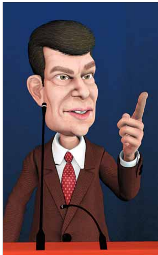
Le Mario Dumont créé par Serge Chapleau pour son émission Et Dieu créa... Lallaque .

Et si nous prenions l'humour politique au sérieux?