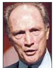
Pierre Elliott Trudeau

Pierre Elliott Trudeau, Céline Dion, Jean Chrétien, Conrad Black et Karla Homolka ont désormais un point en commun. Ces personnages publics sont en effet cinq des dix «pires Canadiens de notre histoire», selon les lecteurs du magazine The Beaver . Et ce, pour l'ensemble de leur œuvre, indique