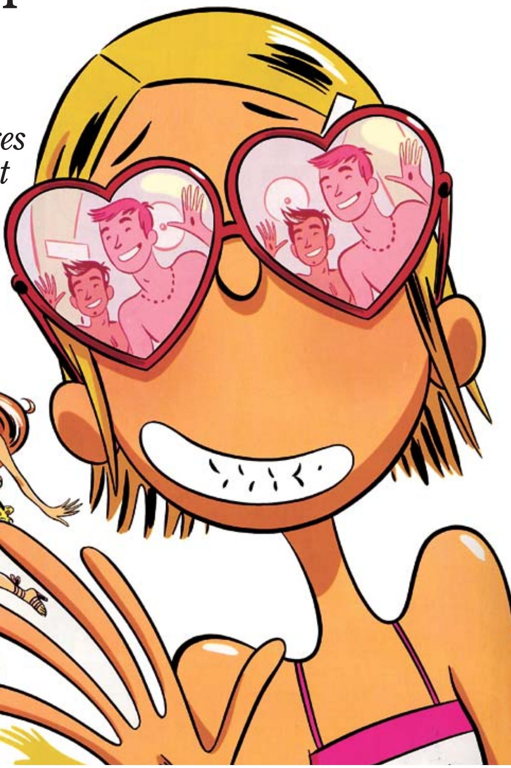
EXTRAIT DES NOMBRILS, DE MARC DELAFONTAINE ET MARYSE DUBUC, ÉDITIONS DUPUIS