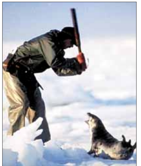
On voit ici un chasseur professionnel qui s'apprête à abattre un phoque adulte, car la chasse aux blanchons est totalement interdite depuis longtemps.