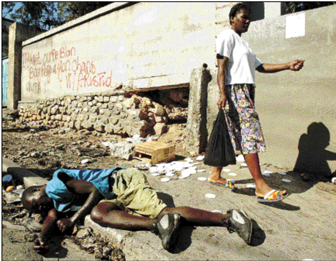
Une femme passe devant le cadavre d'un homme dans une rue de Port-au-Prince au lendemain du départ de Jean-Bertrand Aristide. Les États-Unis ont formellement démenti avoir forcé le président haïtien à quitter le pays à la pointe du fusil.