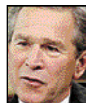
George W. Bush

Le bureau new-yorkais de la maison Léger Marketing a effectué un sondage sur les intentions de vote des Américains à la présidence des États-Unis. Les résultats indiquent que le démocrate John Kerry déferait le président George Bush. La ferveur anti-Bush est très forte chez les démocrates, ce qui laisse entrevoir une forte participation au scrutin. Par ailleurs, le bilan du président Bush devient maintenant un enjeu déterminant pour le résultat de l'élection alors que des enjeux comme l'emploi, la santé et l'éducation pourraient s'avérer déterminants.