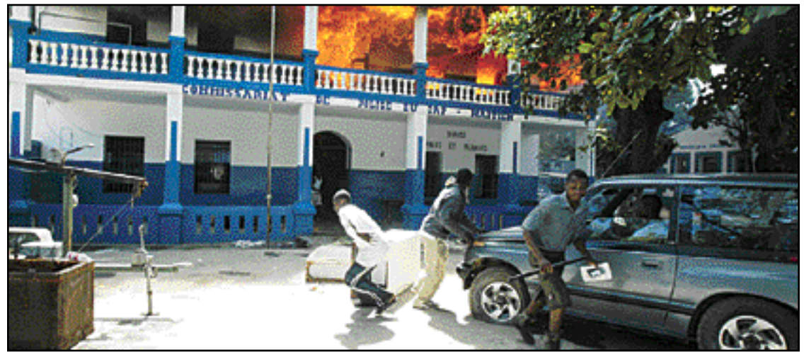
La prise de Cap-Haïtien, deuxième ville du pays, par les rebelles a fait trois morts dont au moins deux parmi les partisans du président haïtien. Le commissariat et la prison, dont ont été libérés les prisonniers, ont été pillés puis incendiés par la population qui s'est ensuite ruée vers le port.