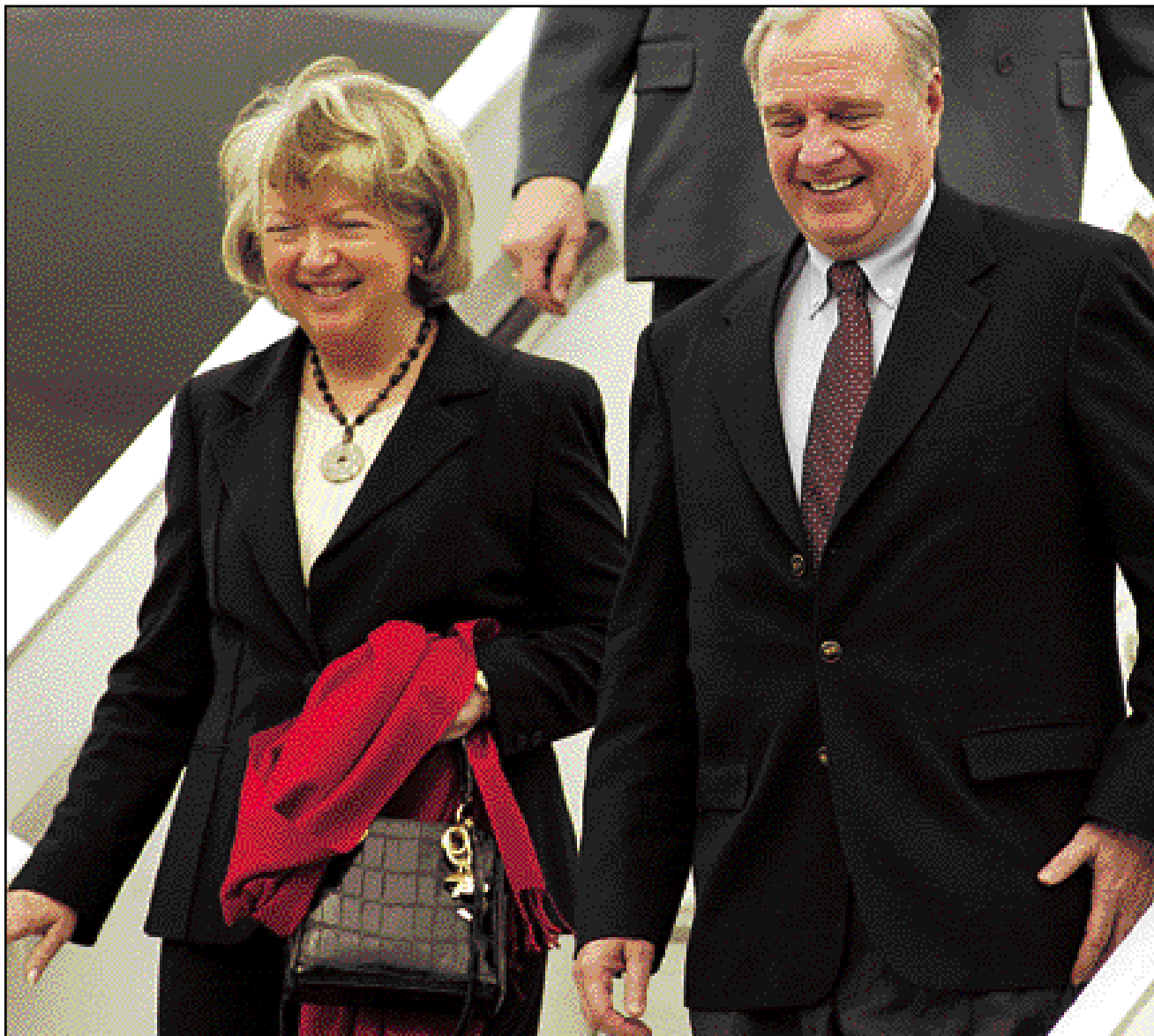
Le premier ministre canadien, Paul Martin, descendant d'avion en compagnie de son épouse Sheila à l'aéroport Mariano Escobedo, à Monterrey. M. Martin est arrivé hier au Mexique afin d'assister pendant deux jours au Sommet des Amériques. Il s'agit de sa première participation à un événement international en tant que premier ministre.